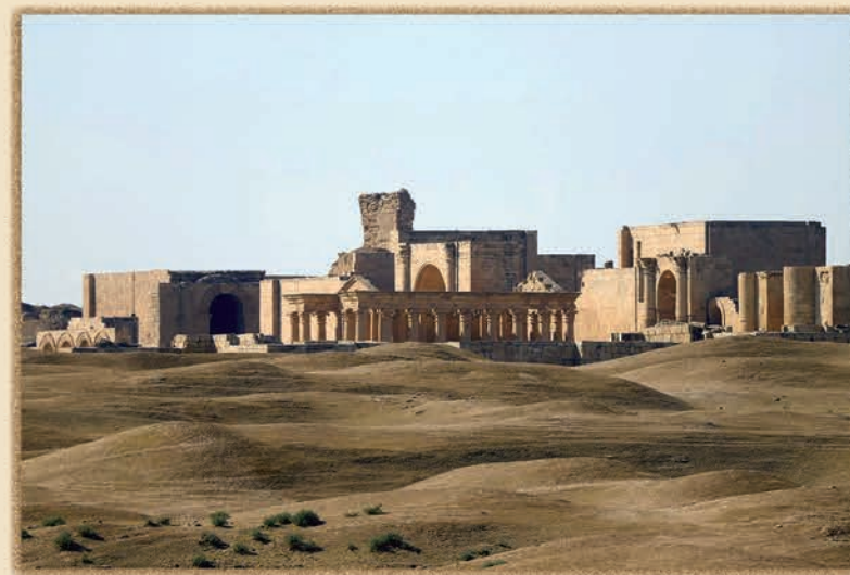
PROGETTO ISMEO/ALIPH AD HATRA, IRAQ