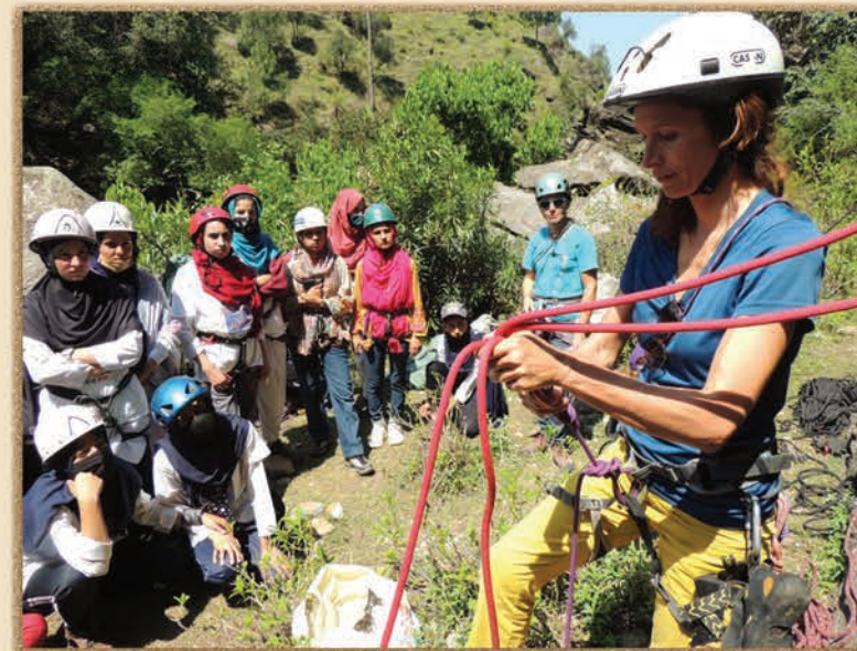
PROGETTO GIRLS IN ACTION, SWAT-PAKISTAN